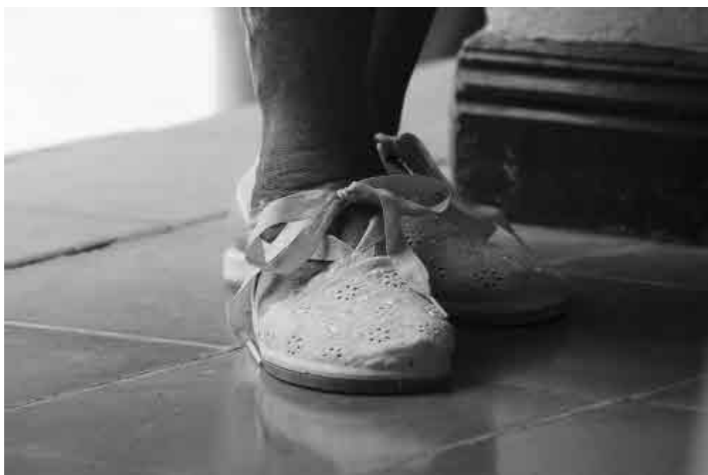
FOTOGRAFÍA, MANUEL SALINAS BUSTAMANTE,